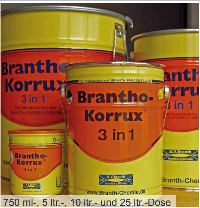
750 ml-, 5 ltr.-, 10 ltr.- und 25 ltr.-Dose

werkstattgerecht, baustellengerecht, umweltgerecht